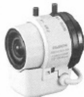
カメラデザインにマッチするホワイトモデル YV2.7×2.9LA-SA4